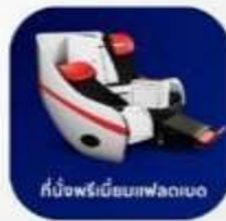
ที่นั่งพรีเมียมเฟลด์เบด