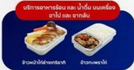
บริการอาหารร้อน และ น้ำดื่ม บนเครื่อง ขาไป และ ขากลับ