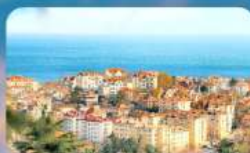
จุดชมวิว Signal Hill Park