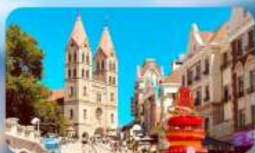
โบสถ์เซนต์โมเคิล