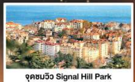
จุดชมวิว Signal Hill Park