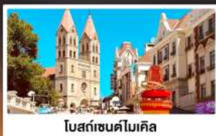
โบสถ์เซนต์ไมเคิล