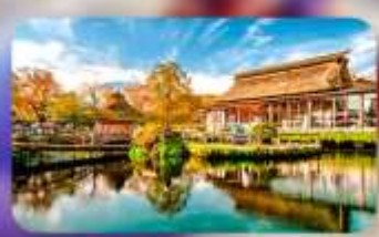
โอชิโนะ ฮักโค