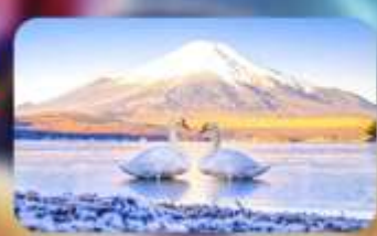
จุดชมวิวกะเลสายามานากาโกะ