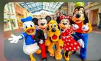
ดิสนีย์อีสรุ