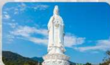
วัดลินห์อิ่ง