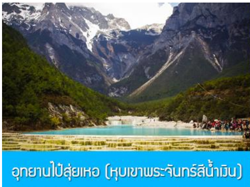
อุทยานโป๋ส่วยเหอ (หุบเขาพระจันทร์สีน้ำเงิน)

หมายเหตุ กรณีที่กระเช้าใหญ่ขึ้นภูเขาหิมะมังกรหยกปิดให้บริการ ด้วยเหตุที่สภาพอากาศไม่เอื้ออำนวย หรือเป็นการปิดเพื่อตรวจสอบสภาพและซ่อมแซมประจำปี ทางทัวร์ขอสงวนสิทธิ์ที่จะจัดโปรแกรมขึ้นกระเช้า ที่จุดชมวิวภูเขาหิมะมังกรหยก ณ สถานีกระเช้าหุยนซานผิง แทน