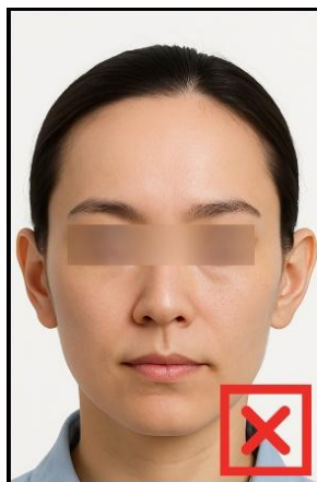
รูปที่ไม่ได้ขนาด ตามที่สถานทูตกำหนด