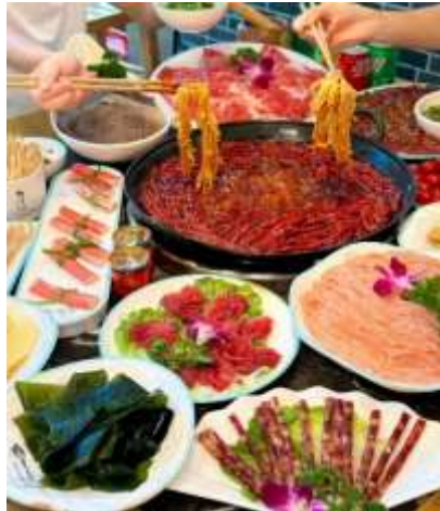
*ภาพนี้ใช้เพื่อการโฆษณาเท่านั้น*