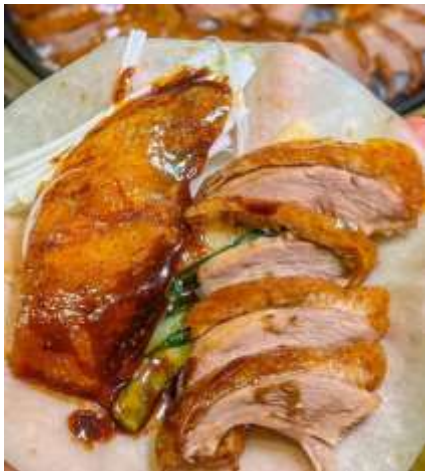
*ภาพนี้ใช้เพื่อการโฆษณาเท่านั้น*