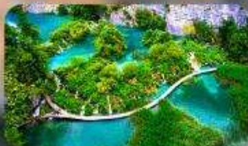
อุทยานแห่งชาติพลิตวิเซ่