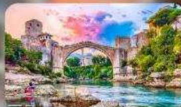
บอสเนียและเฮอร์เซโกวีนา