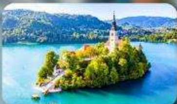
โบสถ์พระแม่มาเรียแห่งเบลค