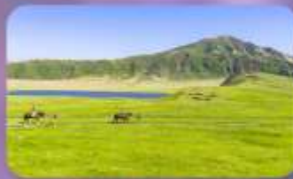
ภูเขาไฟอะโสะ ทุ่งหญ้าคุสะเซนริ