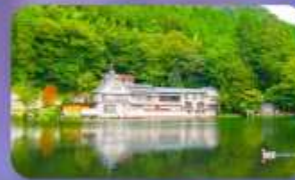
ทะเลสาบคินริน