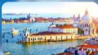
มหานครเวนิส