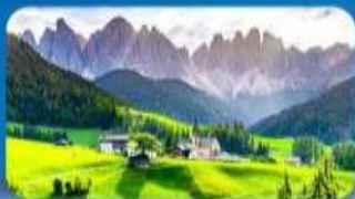
หมู่บ้าน St. Magdalena