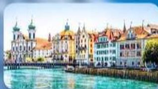
เมืองลูเซิร์น