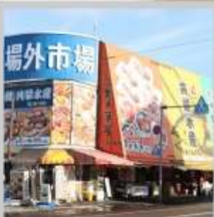
"JOGAI FISH MARKET"