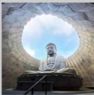
"HILL OF BUDDHA"