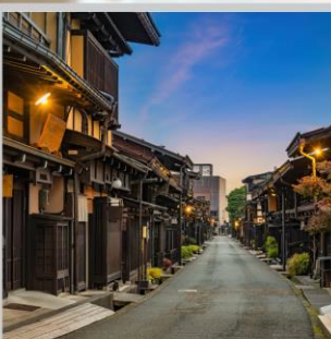
“TAKAYAMA OLD TOWN”