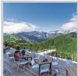
“HAKUBA MOUNTAIN HARBOR”

นำท่านไปโอบกอดธรรมชาติที่ครบครันในที่เดียว “คามิโคจิ” สวิสเซอร์แลนด์แดนญี่ปุ่นเทือกเขาที่ปกคลุมด้วยหิมะสวยงาม ชมความงามของ “ทุ่งพืชมอส ฟุจิชิบะซากุระ” มนต์เสน่ห์..พรมธรรมชาติสีชมพูหลากสีสดใส เปลี่ยนอริยาบท “จันทรະเข้าฮาคุบะ อิวะตะกะ” เพื่อชมวิวพาโนรามาของเทือกเขาแอลป์ญี่ปุ่นกันให้อิ่มใจ สัมผัสกลิ่นอายเมืองเก่า “เมืองทาคายามา” ที่ยังคงอนุรักษ์ความเป็นอยู่ เมื่อสมัยเอโดะกว่า 300 ปี สายช้อปปิ้งห้ามพลาด “คารุอิซาวะ เอ้าท์เล็ต” แลนด์มาร์กของเมืองคารุอิซาวะ และ “ย่านชินจุกุ” แห่งเมืองโตเกียว ชมความงามกับเส้นทาง “เจแปนแอลป์ (ท่าแพงหิมะ)” สุดยอดของการท่องเที่ยวที่ถูกขนานนามว่า “หลังคาแห่งญี่ปุ่น”