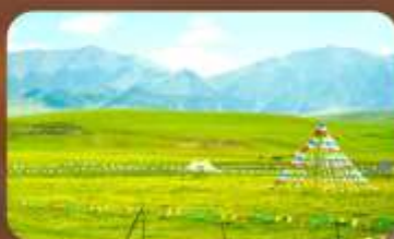
ทุ่งหญ้าออร์คอส