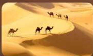
เนินทรายสีงาชวาน