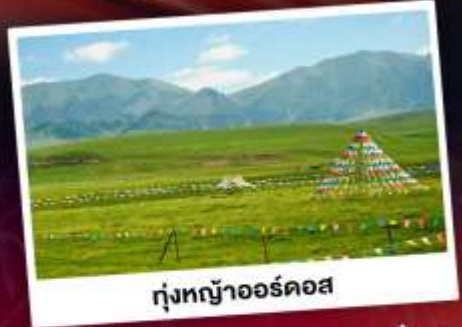
ทุ่งหญ้าออร์ดอส