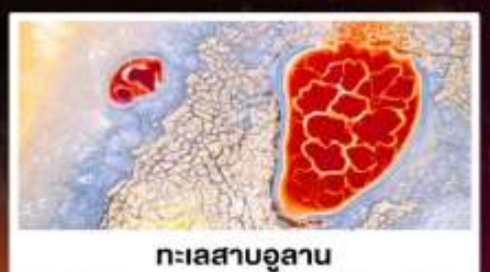
ทะเลสาบอูลาน