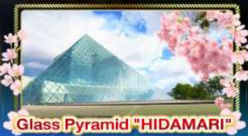
Glass Pyramid "HIDAMARI"