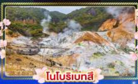
โนบุริเบตสึ

สัมผัสซากุระแสนโรแมนติก เที่ยวครบไฮไลท์ฮอกไกโดใต้ ในช่วงที่สดชื่นที่สุดของปี