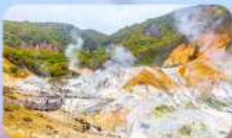
โอบิโรบงส์