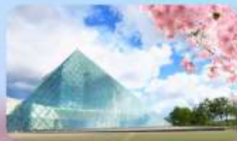
Glass Pyramid "HIDAMARI"