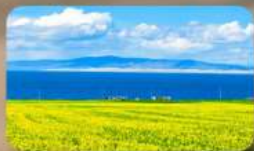
ทะเลสาบชิงไห่