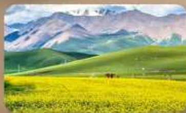
ทุ่งหญ้าซีเหลียน