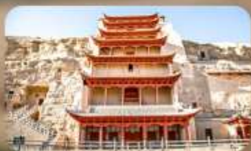
กำม่อเกาคู