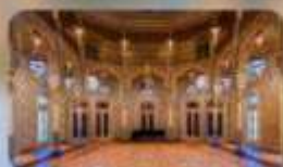
Palacio the Bolsa