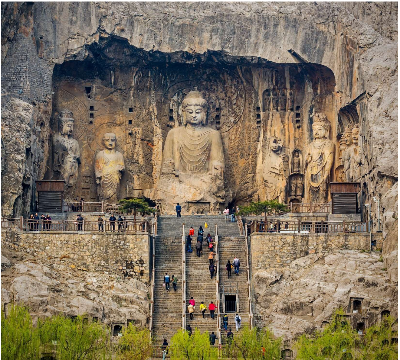
T2G-XIY02(9C) ซีอาน ลั่วหยาง ถ้ำหลงเหมิน หยุนไท่ซาน วัดเส้าหลิน สุสานจิ้นซี 6D 5N (FD)

ถ้ามีความยาวจากทิศเหนือจรดทิศใต้ประมาณ 1 กม. จัดเป็น 1 ใน 3 แหล่งปฏิมากรรมโบราณที่ประกอบด้วย ถ้ำผาม่อเกาคู ถ้ำผาลงเหมิน และถ้ำผาหยุนกั๋ง ที่มีชื่อเสียงที่สุดในจีน ถ้ำผาลงเหมินแห่งนี้ มีอายุราว 1500 ปี เริ่มก่อสร้างในสมัยราชวงศ์เว่ยเหนือ ค.ศ.494 ใช้ระยะเวลาในการก่อสร้างบูรณะและต่อเติมยาวนานถึง 400 กว่าปี จนถึงยุคราชวงศ์ถังและซ่ง ( ราคาทัวร์รวมรถแบตเตอร์แล้ว )