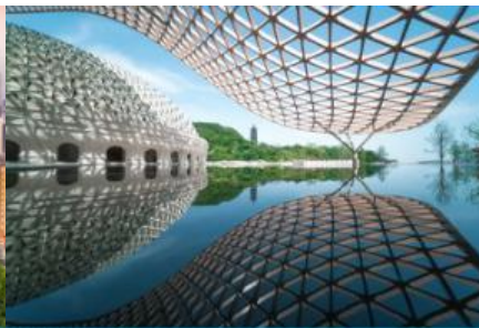
อุทยานก่อกมกั๊วหนิวโล้วซาน