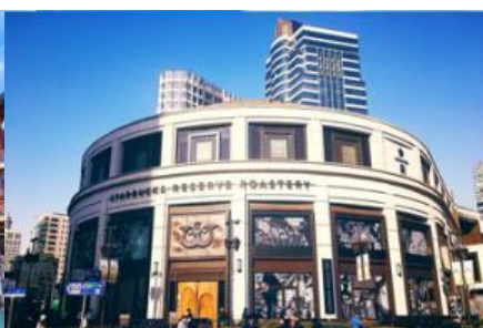
Starbuck Reserve Roastery