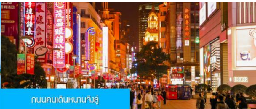
ถนนคนเดินหนานจิงลุ่

จากนั้นนำท่านเดินทางสู่ ย่านช้อปปิ้งที่ใหญ่และคึกคักที่สุดของมหานครเซี่ยงไฮ้ ถนนคนเดินหนานจิงลุ่ 南京路步行街 ให้ท่านเพลิดเพลินกับการเดินเที่ยว ชม และ ช้อปปิ้ง ชิมอาหารหรือของทานเล่นอย่างจุใจ ในย่านถนนคนเดินนี้ นอกจากร้านค้าสินค้าแบรนด์เนมจากต่างประเทศแล้ว สินค้าแฟชั่น และสินค้าแบรนด์จีนก็มีให้เลือกอย่างมากมาย ร้านอาหารและเครื่องดื่มก็มีให้เลือกนั่งเลือกชิมมากมาย.. หรือ ตามล่าหา ลาบูมู ที่ร้าน POP MART ที่ใหญ่ที่สุดในเมืองเซี่ยงไฮ้