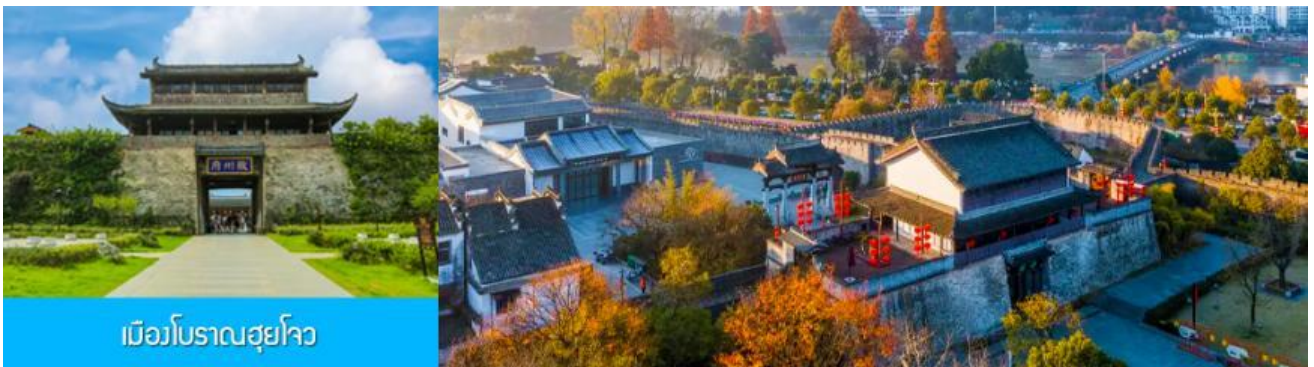
เมืองโบราณซูโจว

จากนั้นนำท่านเดินทางโดยรถบัสสู่ เมืองโบราณซูโจว (ระยะทาง 149 กม. ใช้เวลาเดินทางราว 2 ชั่วโมงเศษ)