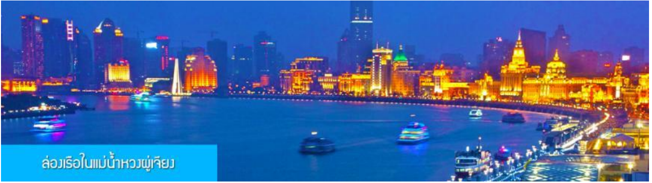
ล่องเรือในแม่น้ำหวงผู่เจียง