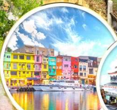
ท่าเรือสายรุ้ง