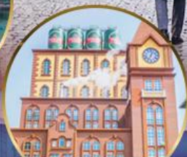
โรงงานเบียร์ชิงเต่า