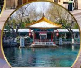
น้ำพุเปาหู