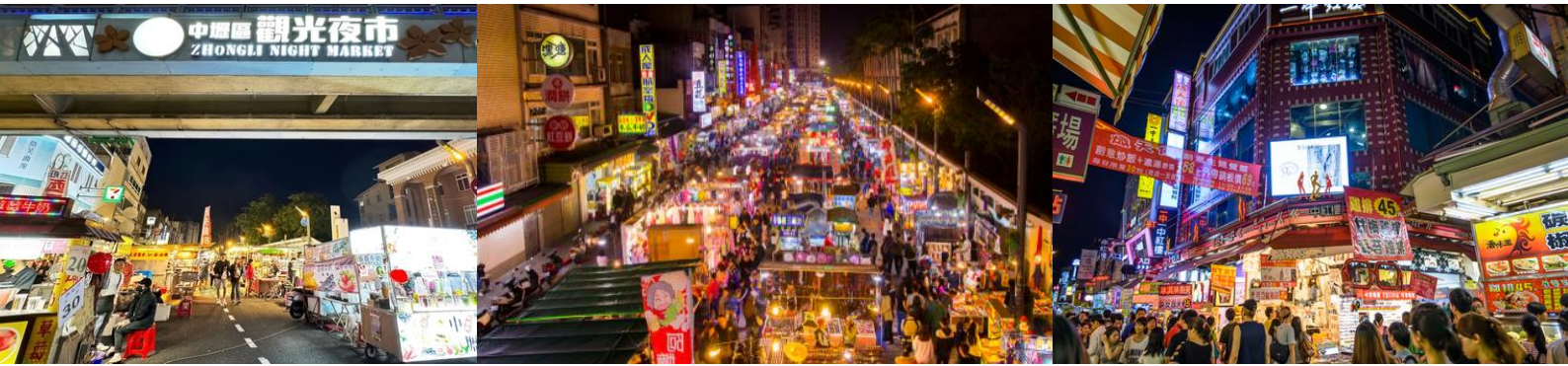
คำ อิสระรับประทานอาหารตามอัธยาศัย เพื่อความสะดวกในการท่องเที่ยว