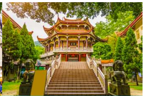
วัดหนานกุ๊วซื่อ