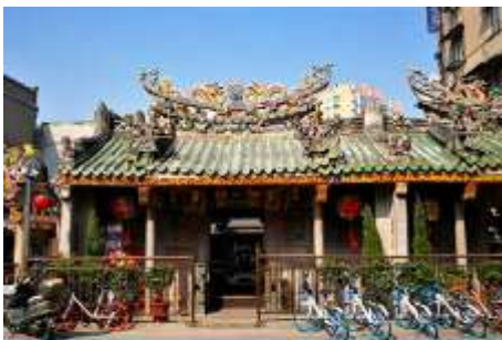
ศาลเจ้าแม่ทับทิม

พักที่ โรงแรม Kyriad Marvelous HOTEL 4* หรือเทียบเท่าในซัวเถา