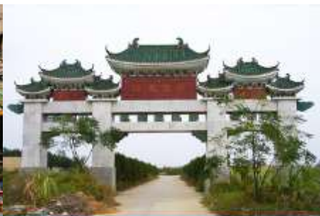
สุสานพระเจ้าตากสิน