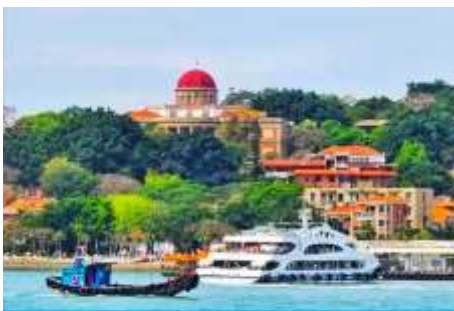
เกาะกู่ลิ่งหยวี

พักที่ โรงแรม XIAMEN HENGLONG HOTEL 4* หรือเทียบเท่าในเซี่ยเหมิน