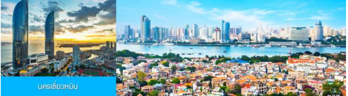
นครซีอะเหมิน

23.30 น. คณะเดินทางพร้อมกันที่ ท่าอากาศยานสุวรรณภูมิ อาคารผู้โดยสารขาออกชั้น 4 ประตูหมายเลข 10 เคาน์เตอร์ เช็คอิน สายการบิน XIAMEN AIRLINES (MF) เจ้าหน้าที่บริษัทฯ คอยให้การต้อนรับและอำนวยความสะดวกในการเช็คอิน