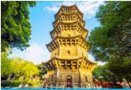
วัดโคหยวน