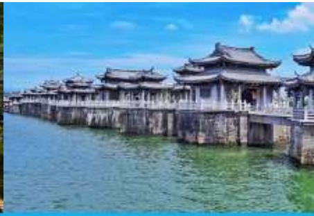
สะพานเซียงจื่อเจียว