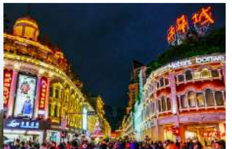
ถนนคนเดิน จวซาลู่