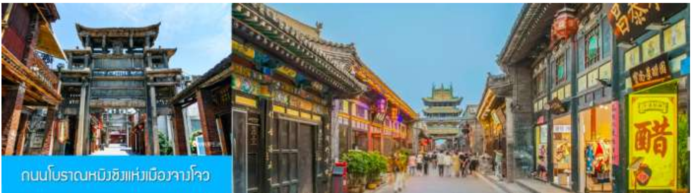
ถนนโบราณหมิงชิงแห่งเมืองจางโจว

หลังอาหารนำท่านเดินทางสู่เมือง จางโจว นำชม ถนนโบราณหมิงชิงแห่งเมืองจางโจว 漳州明清古街 ถนนสายนี้ถูกสร้างขึ้นในราชวงศ์หมิงอายุราว 300 ปี สองข้างถนนเต็มไปด้วยอาคารบ้านเรือนโบราณ ที่อดีตเคยเป็นสถานที่สำคัญของเมืองจางโจว อาทิ ศาลหลักเมือง จวนผู้ว่าเมือง ชุมประตูดินโบราณ ฯลฯ