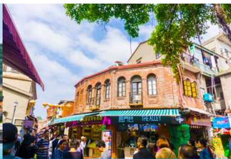
ถนนคนเดินหัวมังกร