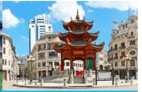
ย่านเมืองเก่าซัวเถา