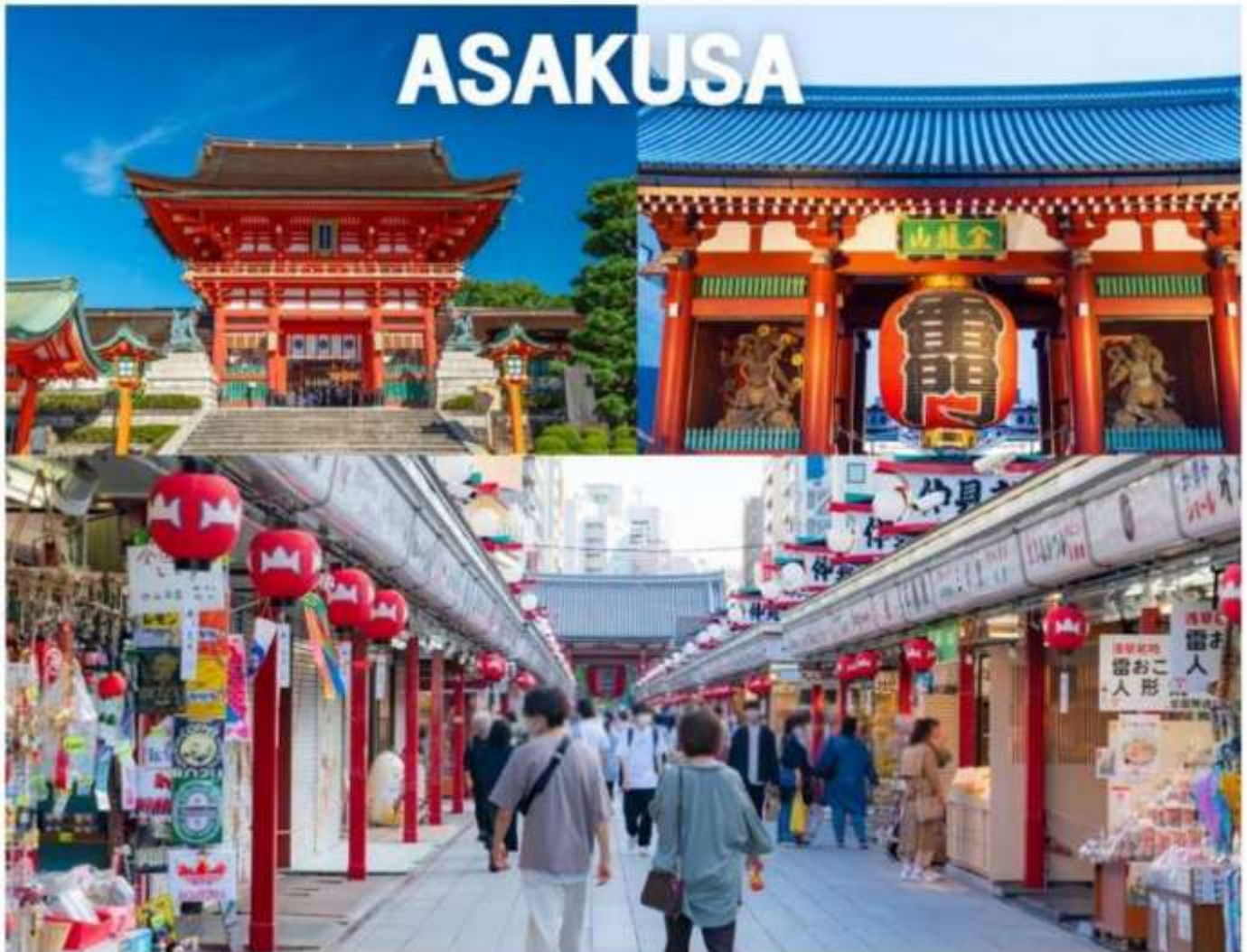
PJPNRT28-SL TOKYO FUJI PINK MOSS FESTIVAL FREE DAY 6D4N

นำท่านเดินทางสู่ “มหานครโตเกียว” เพื่อนมัสการเจ้าแม่กวนอิมทองคำ ณ “วัดอาซากุสะ” วัดที่ได้ชื่อว่าเป็นวัดที่มีความศักดิ์สิทธิ์ และได้รับความเคารพนับถือมากที่สุดแห่งหนึ่งในกรุงโตเกียว ภายในประดิษฐานองค์เจ้าแม่กวนอิมทองคำที่ศักดิ์สิทธิ์ ซึ่งมักจะมีผู้คนมาราบไหว้ขอพรเพื่อความเป็นสิริมงคลตลอดทั้งปี ประกอบกับภายในวัดยังเป็นที่ตั้งของโคมไฟยักษ์ที่มีขนาดใหญ่ที่สุดในโลกด้วยความสูง 4.5 เมตร ซึ่งแขวนห้อยอยู่ ณ ประตูทางเข้าที่อยู่ด้านหน้าสุดของวัด ที่มีชื่อว่า “ประตูฟ้าคาร์ณ” ถนนนากามิเซะ หรือที่หลายๆคนรู้จักกันว่า “ถนนช้อปปิ้งนากามิเซะ” เป็นทางเดินทอดยาวจากถนนหลักที่รวิ้งเข้าสู่พื้นที่ภายในของวัดนั้นแหละค่ะ เนื่องจากวัดอาซากุสะเป็นวัดยอดนิยมของโตเกียวจึงทำให้ถนนเส้นนี้เป็นถนนเส้นที่คึกคักเกือบตลอดเวลา ทั้งสองฝั่งของถนนเต็มไปด้วยร้านค้ามากมาย ทั้งของกินกับของที่ระลึก ไม่ว่าจะเป็น