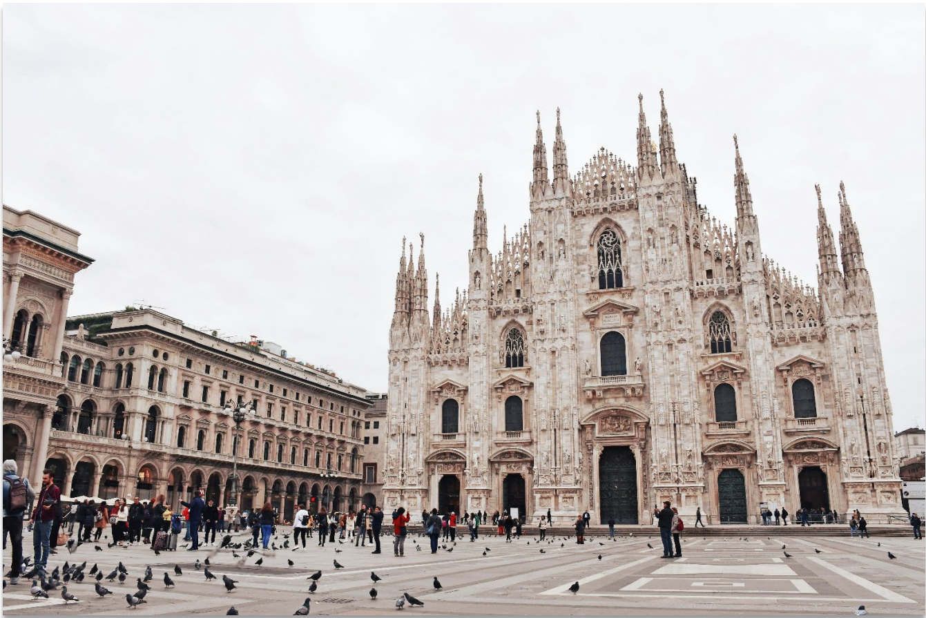
DUOMO DI MILANO

เมืองมิลาน (Milan) มิลานเป็นเมืองสำคัญทางตอนเหนือของประเทศอิตาลี ตั้งอยู่บนที่ราบลอมบาร์ดี โดยชื่อ "มิลาน" มีรากศัพท์มาจากภาษาของชาวเซลต์ คือ "Mid-Lan" ซึ่งมีความหมายว่า “กลางที่ราบ” เมืองมิลานมี ชื่อเสียงระดับโลกในด้านแฟชั่น ศิลปะ และวัฒนธรรม และยังเป็นหนึ่งในเมืองหลักทางเศรษฐกิจของอิตาลีอีก ด้วย นำท่านถ่ายภาพเป็นที่ระลึกบริเวณด้านหน้าของ “มหาวิหารมิลาน” (Duomo di Milano) หนึ่งในมหา วิหารสไตล์กอธิคที่ใหญ่ที่สุดในโลก (ค่าทัวร์ไม่รวมค่าเข้าชมในของมหาวิหารแห่งเมืองมิลาน)นอกจากนั้นให้