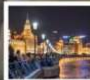
เซี่ยงไฮ้คลาสสิกไนท์