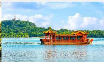
ล่องเรือทะเลสาบหลิวเยว่หู