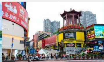
ถนนหวงซิงลู่