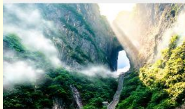
ประตูล้อมรั้ว