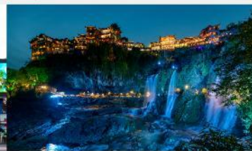
ฝูหรงเจิน

*ทางบริษัทฯ ขอสงวนสิทธิ์ในการสลับโปรแกรมทัวร์ตามความเหมาะสมขึ้นอยู่กับสถานการณ์หน้างาน โดยคำนึงถึงผลประโยชน์ของลูกค้าเป็นสำคัญ