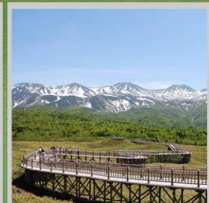
"SHIRETOKO 5 LAKES"