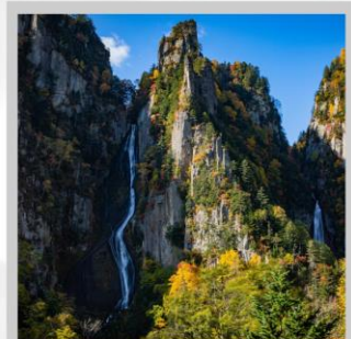
"GINGA & RYUSEI FALLS"

ต้นตา "ทุ่งดอกพืชมอส ณ สวนดอกชิบะซากุระฮิงะชิโมะโคะโคะ" ด้วยพรมสีชมพูที่มีพื้นที่ขนาดใหญ่ถึง 100,000 ตารางเมตร ชม "ทะเลสาบคาบสมุทรชิเรโตโกะ" เกิดมาจากการระเบิดของภูเขาไฟโอโอะและน้ำพุใต้ดิน จนเกิดเป็นทะเลสาบทั้ง 5 ของชิเรโตโกะ "ฟาร์มสุนัขจิ้งจอกฮอกไกโด" ฟาร์มสุนัขจิ้งจอกแห่งเดียวของเกาะฮอกไกโด สายพันธุ์ท้องถิ่นคือ สายพันธุ์ Ezo red fox ผลิตเพลินกับ "เนินสีฤดู" เนินเขากว้างใหญ่ที่มีดอกไม้ไม้บานาพันธุ์นับ 30 ชนิดปลูกเรียงรายสลับสีกันเป็นแนวยาว นำท่าน "นั่งกระเช้าภูเขาคุโรดะเคะ" เชื่อมจากเชิงเขาของเมืองโซอุนเคียวถึงยอดเขาคุโรดะเคะเคะที่มีความสูงถึง 670 เมตร ไฮไลท์ "ส่องเรือราอูสี ชมความงามของวาฬเพชรฆาต" บริเวณคาบสมุทรชิเรโตโกะ มรดกโลกทางธรรมชาติของฮอกไกโด