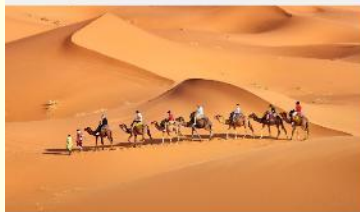
ชีอูฐชมทะเลทราย