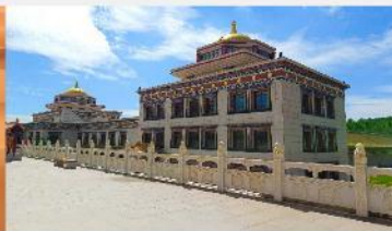
ทำเนียบพระลามะอุหลาน