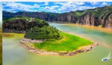
แกรนด์แคนยอนแม่น้ำเหลือง

*ทางบริษัทฯ ขอสงวนสิทธิ์ในการสลับโปรแกรมทัวร์ตามความเหมาะสมขึ้นอยู่กับสถานการณ์หน้างาน โดยคำนึงถึงผลประโยชน์ของลูกค้าเป็นสำคัญ