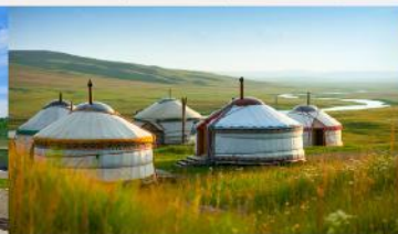
กู่งหว้าออร์ดอส