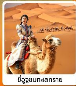
ขี่อูฐชมทะเลทราย