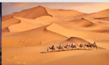
ทะเลทรายเสียงชวาน