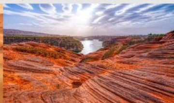
อุทยานหุบเขาคีลิน

*ทางบริษัทฯ ขอสงวนสิทธิ์ในการสลับโปรแกรมทัวร์ตามความเหมาะสมขึ้นอยู่กับสถานการณ์หน้างาน โดยคำนึงถึงผลประโยชน์ของลูกค้าเป็นสำคัญ