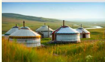
กุ่มหลำออร์ดอส