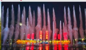
น้ำพุคังปาซื่อ