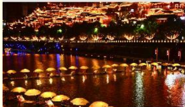
เมืองเซียนเอิน