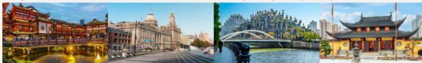
ตลาด 100 ปีเจินหวงเมี่ยว