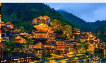
หมู่บ้านโบราณฉูเจียงจ้าย