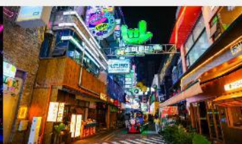
ถนนคนเดินซิงหยุน