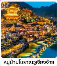
หมู่บ้านโบราณวูเจียงจ้าย