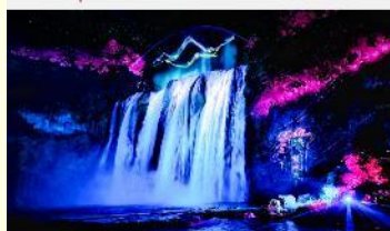
อุทยานน้ำตกหวงกั๋วซู่