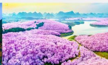
ชากรุง-ผิงป่า

*ทางบริษัทฯ ขอสงวนสิทธิ์ในการสลับโปรแกรมทัวร์ตามความเหมาะสมขึ้นอยู่กับสถานการณ์หน้างาน โดยคำนึงถึงผลประโยชน์ของลูกค้าเป็นสำคัญ