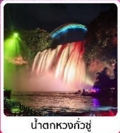
น้ำตกหวงกั๋วซู่