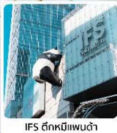
IFS ตึกหมีแพนด้า

● ไอโกล์ นั่งกระเช้าขึ้นชมกุเขาสิมะวาจู่ ซื้อมั้กถนนชุนซีลู่ แลนด์มาร์คแพนด้ายักษ์เป็นตึก IFS เจิงตู