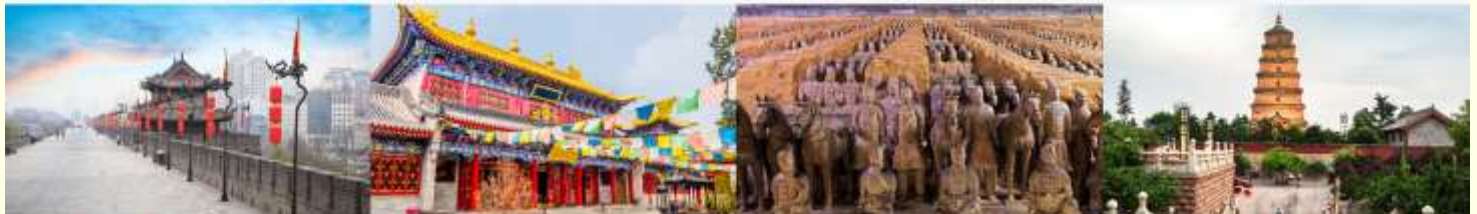
กำแพงเมืองโบราณ