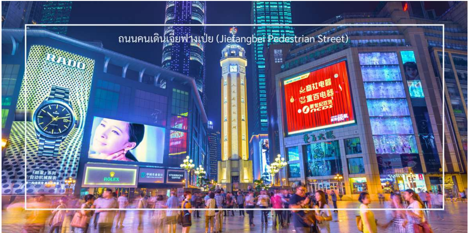
ถนนคนเดินเจี๋ยฟางเป่ย์ (Jiefangbei Pedestrian Street)

สมควรแก่เวลานำท่าน อีสระซ้อปั้ง ถนนคนเดินเจี๋ยฟางเป่ย์ (Jiefangbei Pedestrian Street) ที่แห่งนี้เป็นหนึ่งในแหล่งช้อปปิ้งและท่องเที่ยวที่สำคัญที่สุดในเมืองฉงชิ่ง (Chongqing) เป็นพื้นที่ที่มีชีวิตชีวาและคึกคัก มีร้านค้า ร้านอาหาร และสถานบันเทิงมากมาย ถนนสายนี้มีบรรยากาศที่มีชีวิตชีวา โดยเฉพาะในช่วงเย็นที่มีแสงไฟและการแสดงต่างๆ ที่ทำให้บรรยากาศน่าสนใจยิ่งขึ้น และยังเต็มไปด้วยร้านค้าแบรนด์เนม ร้านค้าท้องถิ่น และตลาดที่ขายสินค้าต่างๆ เช่น เสื้อผ้า เครื่องประดับ และของที่ระลึก แวะชมร้าน POP MART ร้านดังจากจีน ที่รวมฟิกเกอร์ดีไซน์เก๋และตุ๊กตาน่ารักหลากหลายซีรีส์ยอดนิยม เช่น Molly, Dimoo, Labubu และอีกมากมาย