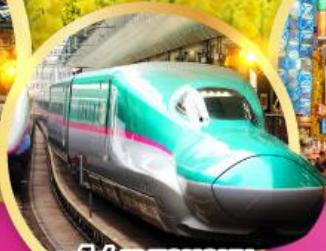
รถไฟ JR TOHOKU SHINKANSEN LINE

ชมทุ่ง ดอกเรพซิด สวนดอกไม้ ะคุโร การ์เด็น