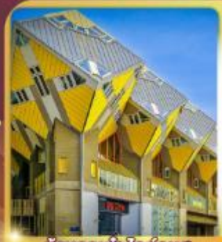
บ้านลูกเต่า โค้คคูมูส

“ล่องเรือหลังคากระจก” ชมกรุงอัมสเตอร์ดัม