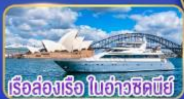
เรือล่องเรือ ในอ่าวซิดนีย์