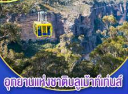
อุทยานแห่งชาติบลูเมาท์แท่นส์