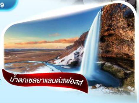
น้ำตกเซลยาแลนด์สฟอสส์