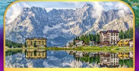
ทะเลสาบมิสุรีนา