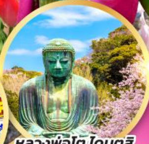
หลวงพ่อดโต โดบุตสึ