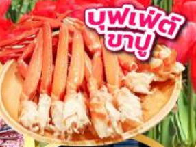
บุฟเฟ่ต์ ขาปู