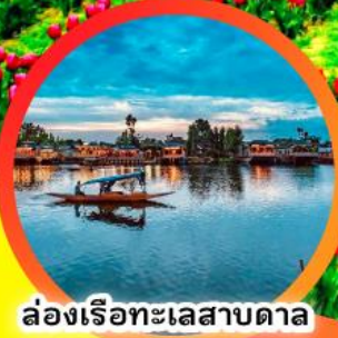
ล่องเรือทะเลสาบตาเล