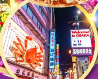
ช้อปปิ้งชินไซ บาชิ