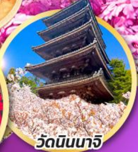
วัดนินนาจิ

ฟูจิ ซิบะ ซากุระ เฟสติวล (PINKMOSS) ถ่ายรูปเช็คอินวิวฟูจิ ชุมประตูโทเซกิจิ