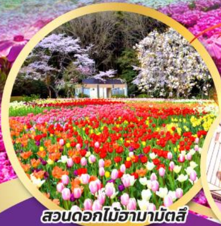
สวนดอกไม้ฮามามัตสึ