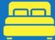
ห้องพักดับเบิล DOUBLE