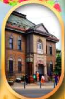
พิพิธภัณฑ์กล่องดนตรี