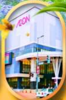
อออนมอลล์