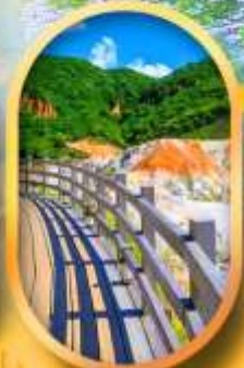
โนโบริเบทสึ