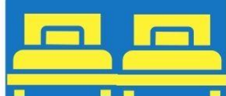
ห้องพักเตียงคู่ TWIN