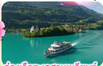
ล่องเรือทะเลสาบเบรียนซ์

พิชิตยอดเขาซุนเนกกา 1 ในเขาที่สวยงามที่สุดเมืองเซอร์แมท