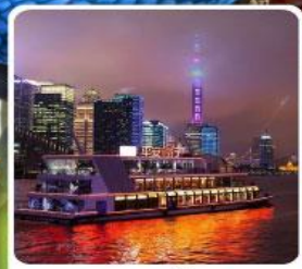
ล่องเรือแม่น้ำหวงผู่