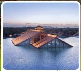
พิพิธภัณฑ์ไดน้ำกวางฟู่หลิน