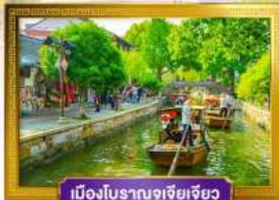
เมืองโบราณซูโจว