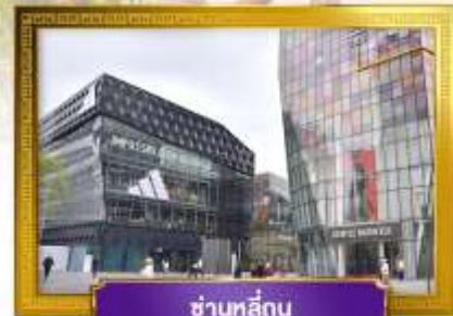
ชานหลู่กู่