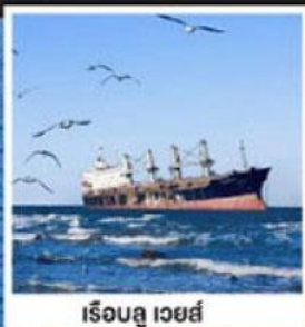
เรือลู เวย์ส์