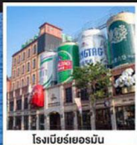
โรงเบียร์เยอรมัน